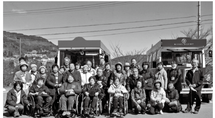
千曲市ボランティア連絡協議会・千曲市身体障害者福祉協会