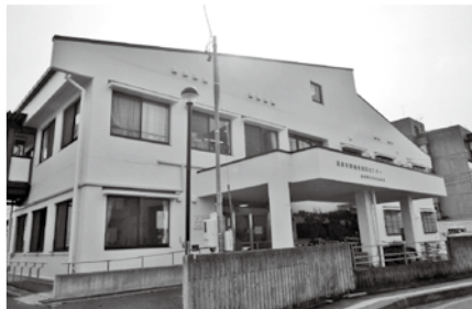
障害者福祉センター 正面