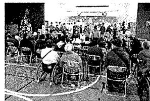
ステージ発表「麦っ子広場」

12月8日、障害者福祉センターにおいて、「クリスマスの集い」を開催しました。昨年を上回る170名の皆様に参加をいただき、ステージ発表やスタンプラリーなどで、参加者やスタッフの皆様楽しんでいただきました。