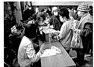
スタンプラリー（中身は何かな）