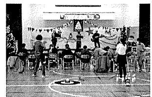
ステージ発表「アンバランちゅ」