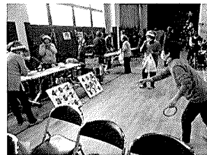
スタンプラリー（輪投げ）